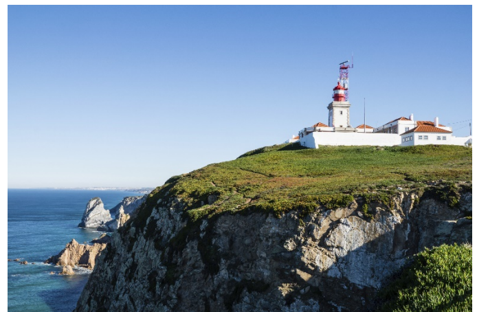
Cabo da Roca

Heute heißt es Abschied nehmen. Im Laufe des Vormittags erfolgt der Transfer zum Flughafen und der Rückflug nach Wien. (F)