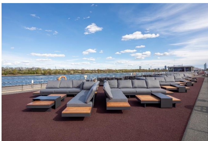
MS Nestroy, Sonnendeck Loungebereich