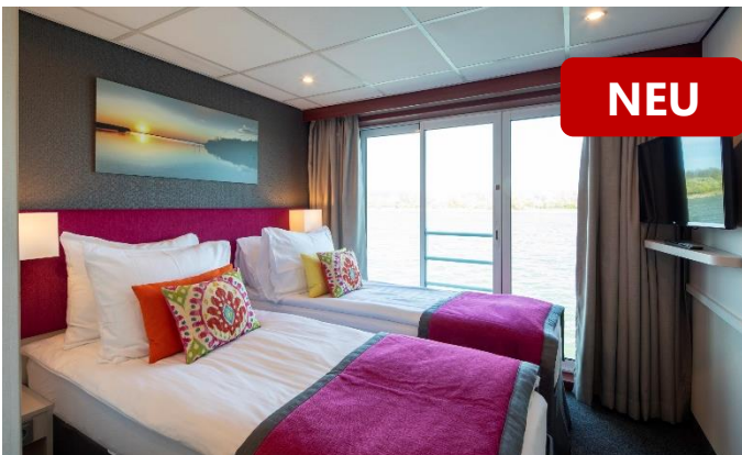
MS Nestroy, Doppelkabine Goethe- /Schillerdeck

Hinweis: Fakultative Ausflüge in der ersten Woche der Reise nur an Bord buch- und bezahlbar. Preise werden an Bord bekanntgegeben.