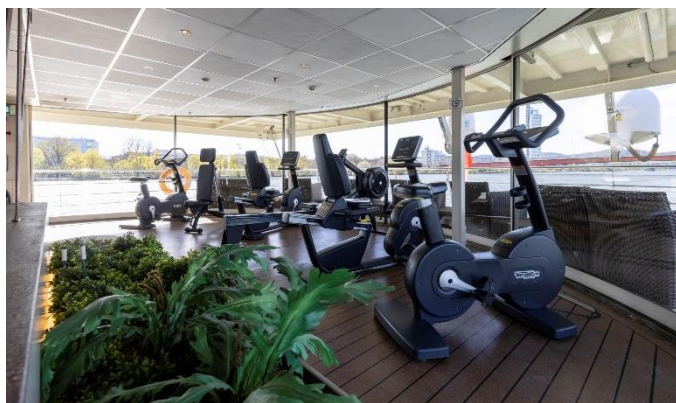
MS Nestroy, Panorama . Fitnesscenter

Morgens legen wir in Budapest an und sagen nach einem letzten Frühstück an Bord der MS Nestroy Lebewohl.